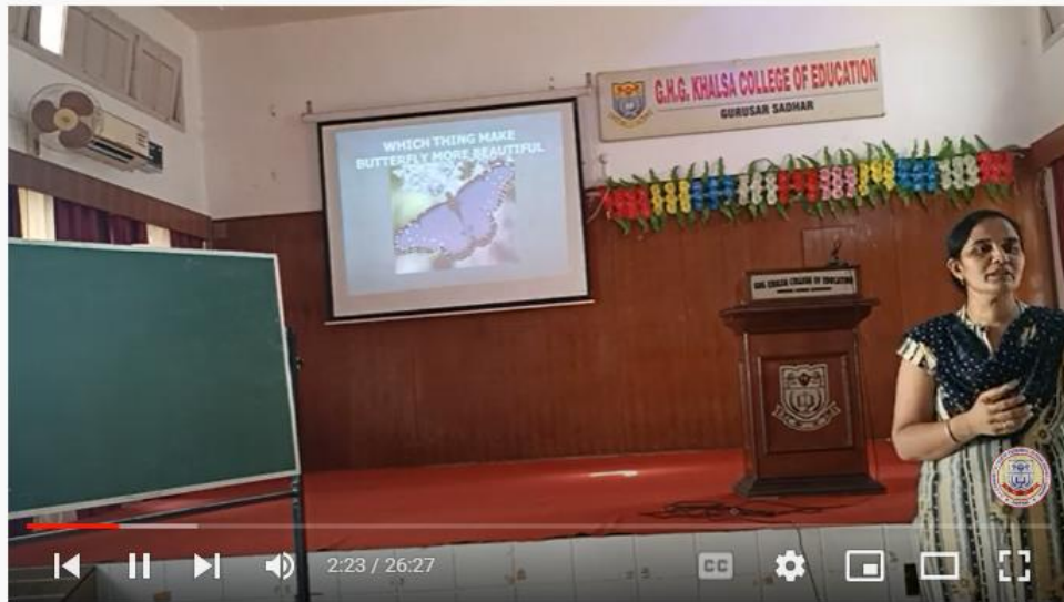
Demonstration Lesson || Pedagogy of Mathematics